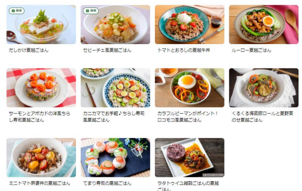
公式サイトで紹介している「夏越ごはん」のレシピ

夏越ごはん公式サイト URL https://www.komenet.jp/nagoshigohan/