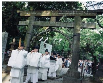
「夏越の祓」神事の様子(赤坂氷川神社)

毎年、神社では「夏越ごはん」ポスターの掲示、ご参拝者へのご神饌として「夏越ごはん」リーフレットと雑穀米を配布いただいています。今年ご協力いただくのは、東京都内の神社139社で、2015年当初の34社から4倍以上に増加しています。