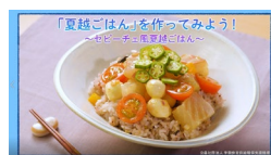
7. セビーチェ風夏越ごはん動画