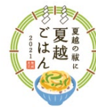
8. 夏越ごはんアイコン（ごはんあり）