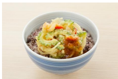
1. 夏越ごはんイメージ画像

また、画像・動画等を使用の際は、使用した原稿やデザインデータ等の提供をお願いいたします。