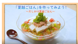
6. だしかけ夏越ごはん動画