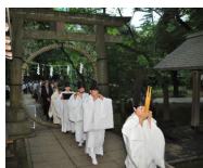
2. 赤坂氷川神社 夏越の祓