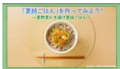
5. おすすめ夏越ごはん動画