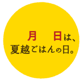
14. 夏越ごはん（日付なし）