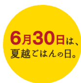
13. 夏越ごはん（日付あり）