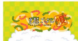
4. 夏越ごはんの唄（動画 15 秒 or 56 秒）