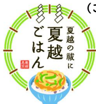
10. 夏越ごはんアイコン (ごはんあり)