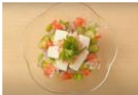
8. だしかけ夏越ごはん