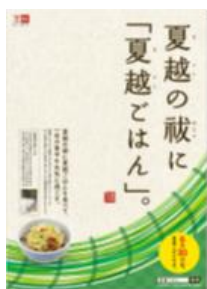
18. ポスターデータ(サイズ:A2)